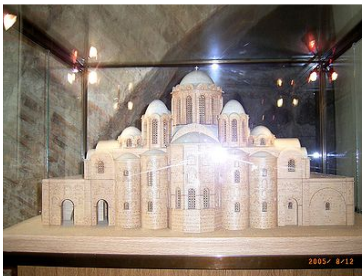
Архітектурна модель Софійського собору, Київ