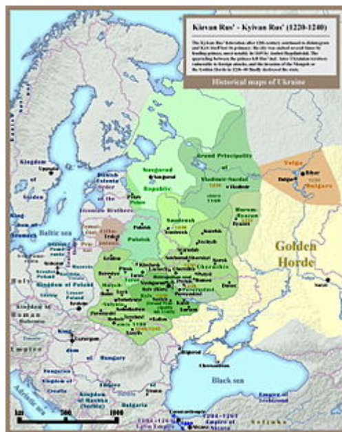
Мапа Київської Русі (1220–1240)

У розвитку культури Русі проявлялися як загальні закономірності, так і національні особливості. Її основа — самобутня культура східнослов'янських племен. Принциповим рубежем у розвитку культури стало прийняття християнства. Значним був вплив візантійської культури. На відміну від Західної Європи, на Русі держава не підпала під владу церкви, і, відповідно, в культурі світські елементи були сильнішими. Намітилася прогресивна тенденція диференціації духовної культури. У відносно короткі терміни Київська Русь зробила величезний крок, вийшовши на загальноєвропейський культурний рівень, а в деяких її сферах перевершивши його. Нові віяння в культурі, більша регіональна своєрідність з'явилися у зв'язку з феодалною роздрібненістю. Однак для закріплення і розвитку культурної динаміки Русь потребувала відновлення політичної єдності.