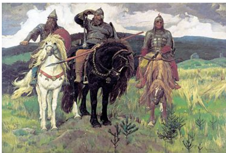
Три богатирі — Ілля Муромець, Добриня Микитич, Альоша Попович (В. М. Васнецов, 1898 р.)

У творах літераторів того часу широко використовувалися героїчні й обрядові пісні, загадки, прислів'я, приказки, замовляння і заклинання. За свідченням автора «Слова о полку Ігоревім», народні мотиви лягли в основу творчості «віщого Бояна», якого він назвав «солов'єм старого часу». Народні пісні і перекази широко використовувалися літописцями. Від усної народної творчості древньої Русі у фольклорі українського народу збереглися найяскравіші зразки обрядової поезії — колядки і щедрівки.