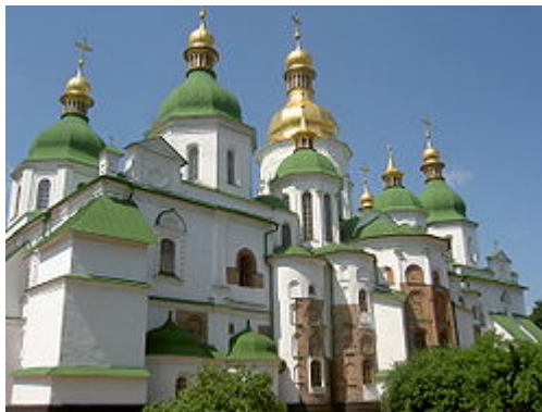
Софіївський собор у Києві

Втіленням головних архітектурних досягнень Русі став Софійський собор у Києві, який зберігся до наших днів, але в дуже перебудованому вигляді. Він був споруджений при Ярославі Мудрому на місці його перемоги над печенігами і задуманий як символ політичної могутності Русі. Софіївський собор став місцем посадження на князівський стіл і поставлення на митрополичий престол, місцем прийому іноземних послів, зустрічей князя з народом.