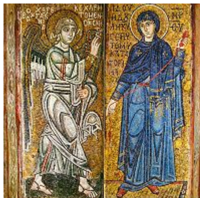
Благовіщення, мозаїка, собор Св. Софії, Київ.

Древньоруські майстри удосконалили візантійський тип кладки. Стіни соборів викладалися з рядів каменю, які чергуються, і плінфи (плоска цегла, близька до квадратної форми). Будівельники застосовували метод так званої «утопленої плінфи», коли ряди цегли через один були заглиблені в стіну, а проміжки, які утворилися, заповнювалися цем'янкою (розчин вапна, піску і товченої цегли). У результаті стіни були смугастими. Сірий граніт і червоний кварцит у поєднанні з оранжево-рожевим кольором плінфи та рожевим відтінком цем'янки надавали фасаду ошатного вигляду. Кладка виконувалася на високому художньому рівні і була однією з головних прикрас будівлі. Пізніше київську кладку запозичила і Візантія.