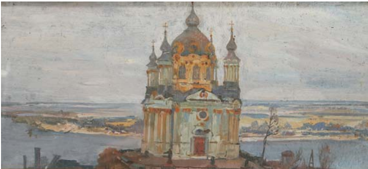
Ф. Коновалюк. Андріївська церква. 1940 р.

На одрі вже – наготові, а ще молодшає у слові та ще привіт у вічність шле Шевченку й Коновалюкові; і церкві тій, Андріївській, космічній в році сороковім.